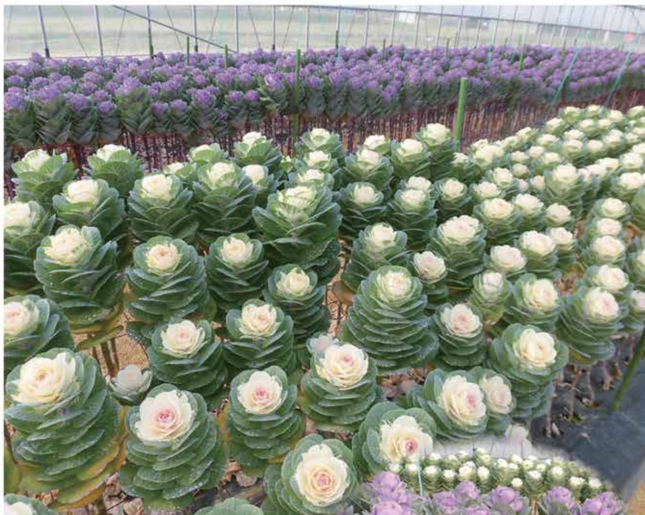
株営農福井ハウス