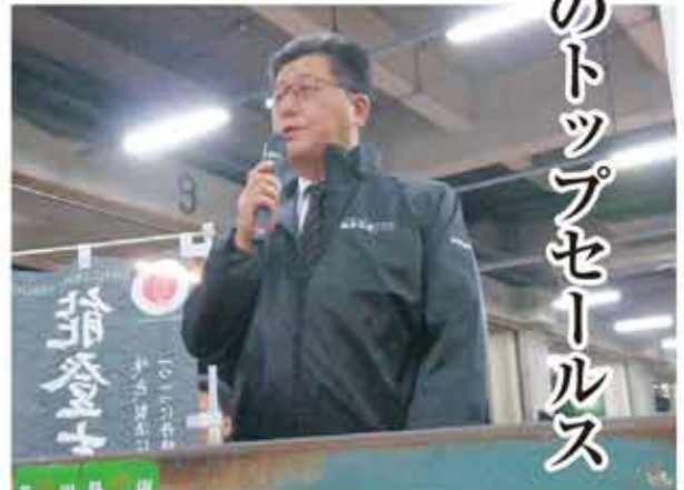
新谷組合長のトップセールス（金沢市中央卸売市場）