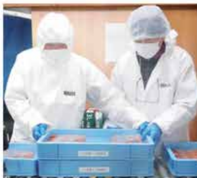
品質検査（重さ、色の確認）