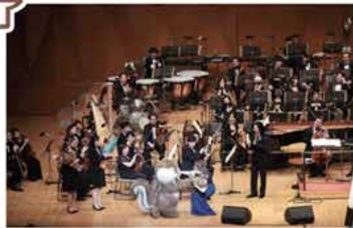
JAバンクのキャラクターでおなじみ「ちょリス」が花束を贈呈

この企画はJAで年金の振込を指定していただいている方で、ご応募いただいた方の中から抽選で招待しており、JA志賀は40名招待しました。