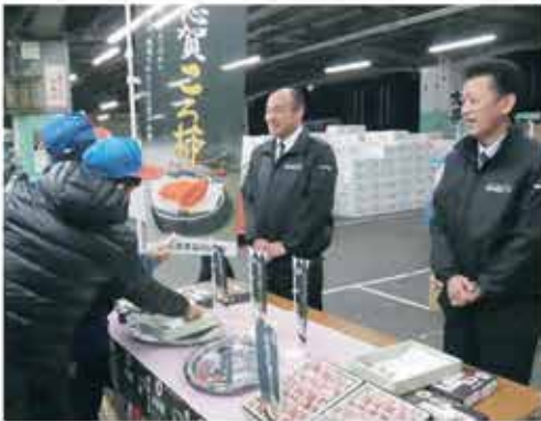
包装を確認する卸売業者

「能登志賀ころ柿」に対し金沢市中央卸売市場で15万円、大阪市中央卸売市場で17万円をつけていただく事ができました。