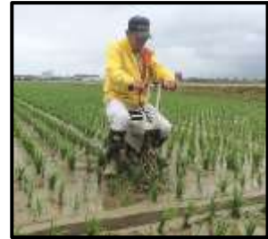
乗用溝切機を使用した溝切りの様子