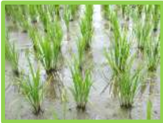
【中干し開始の目安の株】