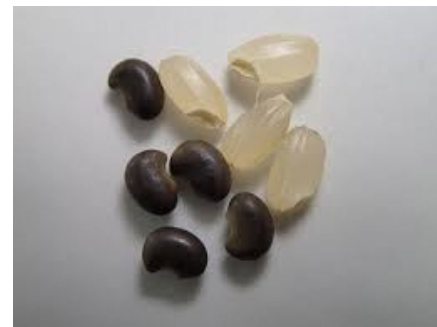
クサネム種子(黒い粒:左)

・クサネムの種子(右の写真)は、ライスグレーダーで取り除けないため、異物混入で落等の原因となります。