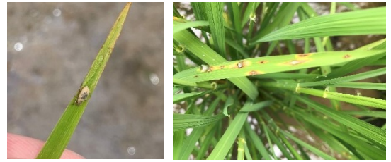
イネミズゾウムシ